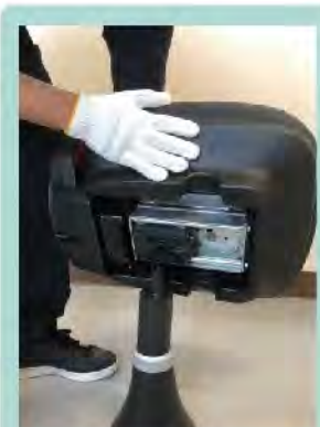
おもて面②の手順で座席をはめ込みます。