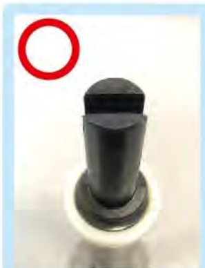
ポールを盤面に対して正面へ