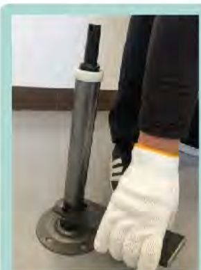
おもて面の手順でポールを外します。