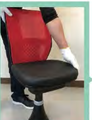
座席を斜めにはめ、ゆっくりと正面にもどすと、軽く沈み込みます。